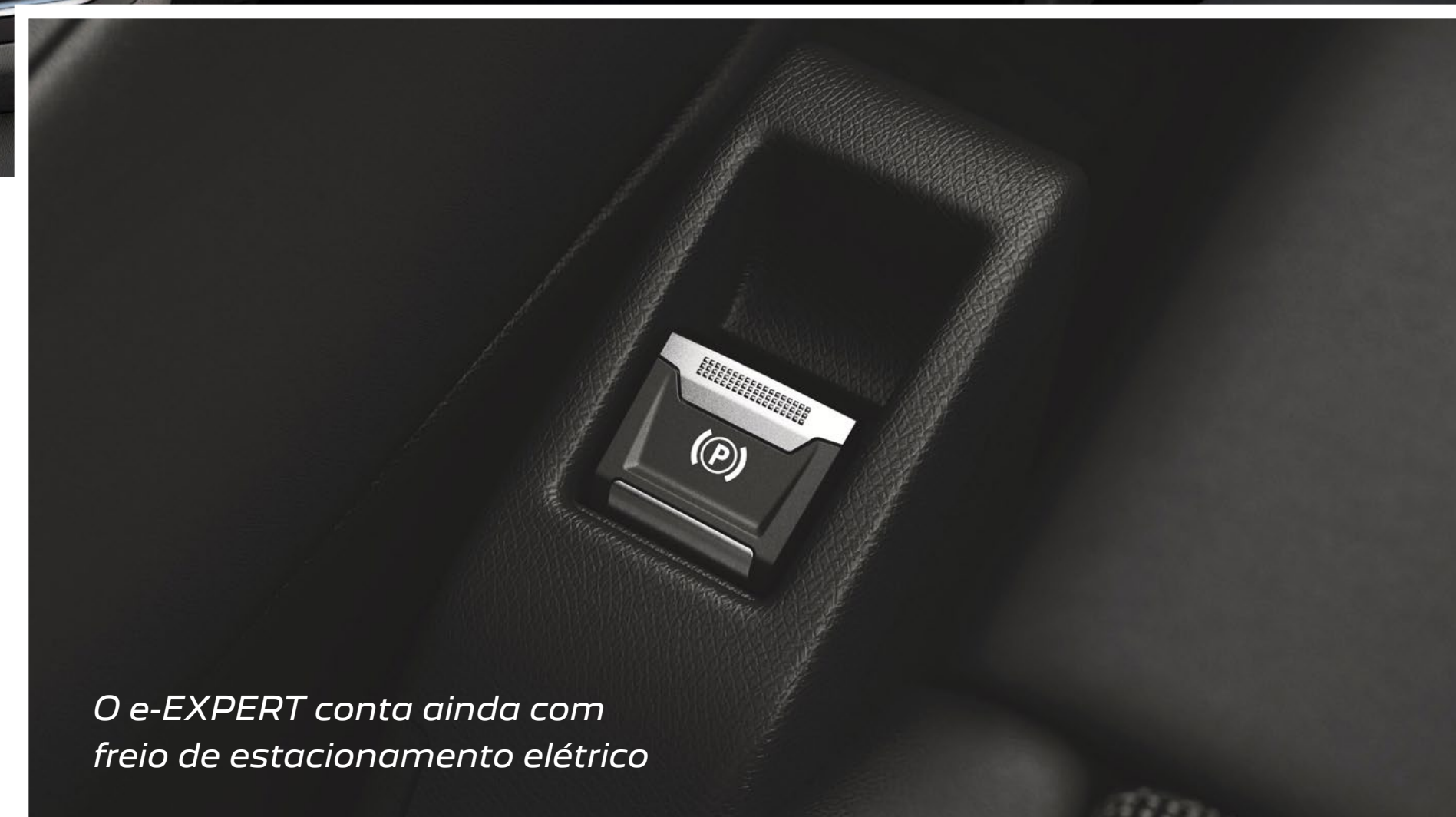
O e-EXPERT conta ainda com freio de estacionamento elétrico

O e-EXPERT conta com amplo espaço interno na cabine para até 3 passageiros com conforto e tecnologia de um carro de passeio, além de recursos de segurança, como o alerta de fadiga, controle eletrônico de estabilidade, assistente de partida em rampa, sistema de monitoramento de pressão dos pneus, limitador de velocidade e piloto automático.